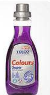
Before and after - Washing liquid

To get a good understanding of where we could make these changes, we started working with Government agency WRAP (Waste & Resources Action Programme). WRAP encourages businesses and consumers to be more efficient in their use of materials and to recycle more things more often.